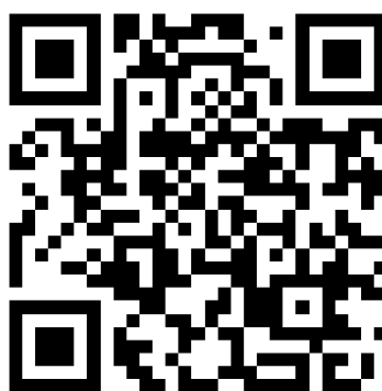
第四届中国收缩城市学术研讨会 报名表（含会议投稿）