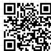
第四届中国收缩城市学术研讨会 报名表(含会议投稿)

协办： 北京城市实验室 (BCL) 清华大学建筑学院 中山大学地理科学与规划学院 湖南大学建筑学院 首都经济贸易大学城市经济与公共管理学院